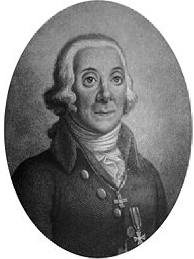
Петр Симон Паллас

Петр Симон Паллас (1741–1811, Германия, Россия) Сравнительные словари всех языков и наречий (1787–1789, второе изд. 1791): избранный словник по 276 языкам и диалектам Европы, Азии, Америки и Африки.