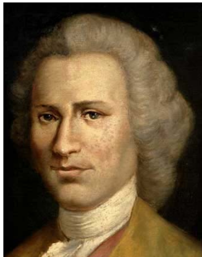
Жан Жак Руссо

Рассуждение о начале и основах неравенства между людьми (1755), Опыт о происхождении языков (1761): два периода в жизни языка, связанные с двумя периодами в жизни человечества – природным и цивилизованным.