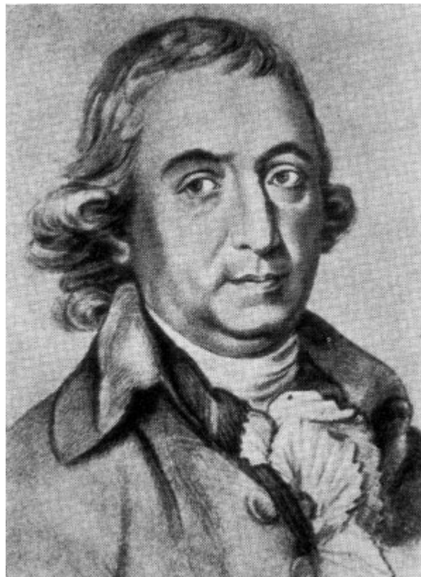
Иоганн Готфрид Гердер