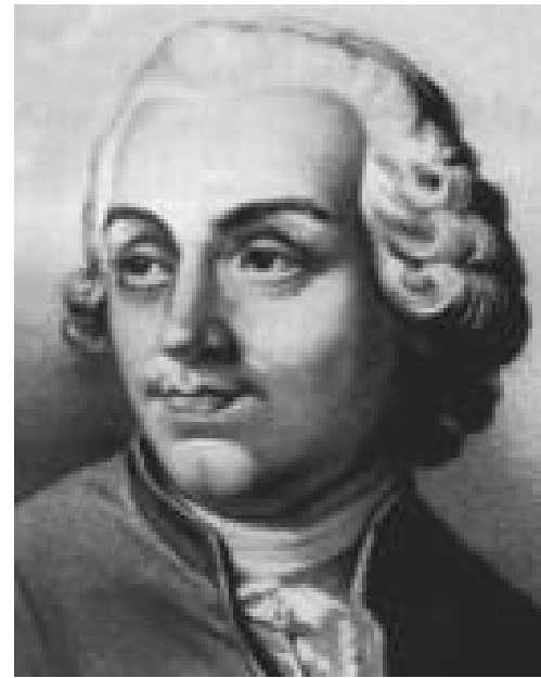
Этьен Бонно де Кондильяк

Этьен Бонно де Кондильяк (1715–1780, Франция) Опыт исследования происхождения человеческих знаний (1746): слова членораздельной речи стали выступать знаками, которые использовались для образования понятий.