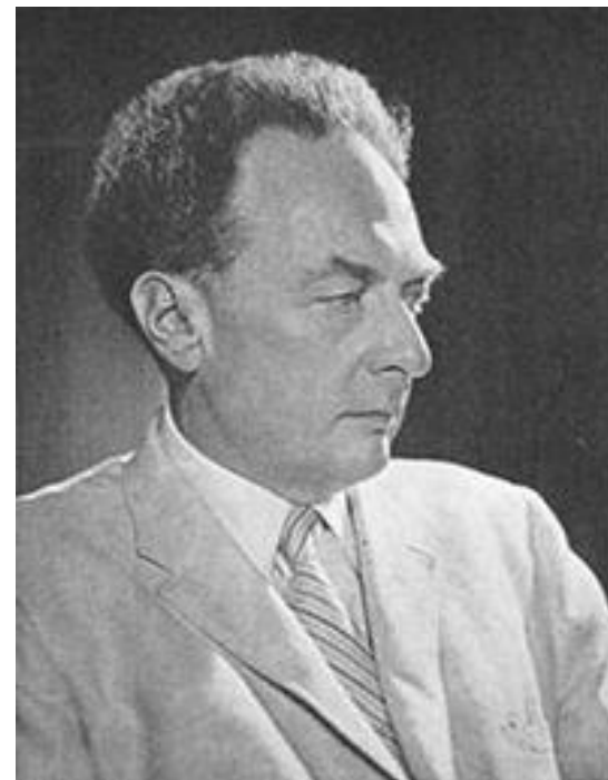
Роман Осипович Якобсон http://dic.academic.ru/ «Словари и энциклопедии на Академике»

Шифтеры, глагольные категории и русский глагол (1957): классификация глагольных категорий с опорой на ограниченный набор семантических признаков.