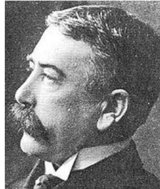
Ferdinand de Saussure